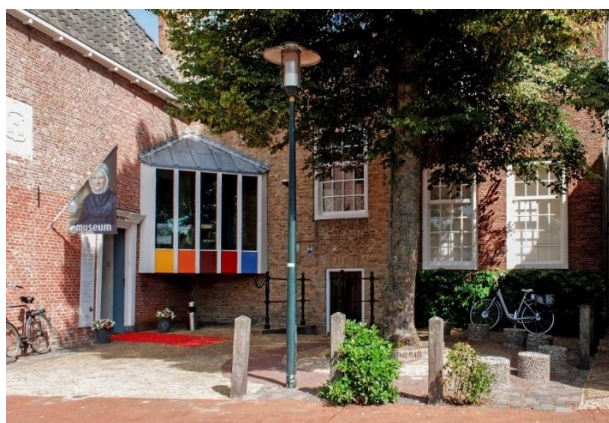
Voorzijde Museum Dokkum, Diepswal 27.

Het museum vroeg in 2019 bij de provincie een subsidie aan voor restauratie van de Trekschuit. Het projectplan werd goed bevonden en er is een subsidie van 16.500,- euro aan ons toegewezen voor het uitvoeren van de restauratie in 2019/2020. Hiermee konden we een deel van de gemaakte kosten betalen, de over gebleven kosten werden door ons zelf voldaan. Inmiddels is de restauratie afgerond en gaan we, met instemming van de provincie, dit project in 2021 afsluiten met een educatief project. Ook deze feestelijke afsluiting kon door de corona maatregelen in 2020 niet doorgaan.