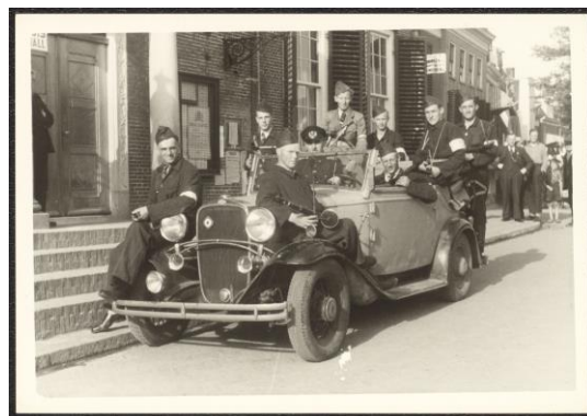
Bevrijdingsfoto Dokkum, na 14 april 1945

We werken ook verder aan een update/upgrade/herinrichting van de vaste presentatie. Hierbij zal scherp gekeken worden naar de eisen zoals beschreven in de toeristische visie gemeente Noardeast-Fryslân, waarin Dokkum speerpunt is. Ook proberen we een betere aansluiting te vinden bij de in 2021 gemarkeerde hotspots van Dokkum en de hieraan verbonden thematiek. Pas bij een volledige herinrichting kunnen we echt ingrijpende wijzigingen gaan aanbrengen, maar daar waar met kleine ingrepen al wel een voorschot kan worden genomen laten we dit natuurlijk niet na. Op dit moment is het nog niet duidelijk welke consequenties een herinrichting/verbouw van Museum Dokkum hebben op ons expositieplan 2022 en daarna.