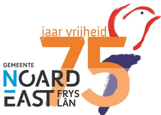
Logo 75 jaar vrij

De werkgroep tentoonstellingen maakt in 2022 minimaal drie wisseltentoonstellingen. Op dit moment is het nog niet duidelijk welke exposities er in 2022 te zien zullen zijn. Wel is al duidelijk dat een uitgestelde tentoonstelling uit 2020 in 2022 te zien zal zijn. Het betreft de expositie Dokkum vrij (tgv 75-jarige viering van de bevrijding). Deze expositie, waarvoor we extra geld kregen van de gemeente stond in 2020 klaar, maar corona stond de opening in de weg. Uiteindelijk besloten we deze expositie in overleg met de gemeente te verschuiven naar een ander moment.